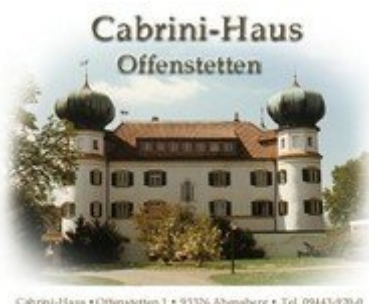
Cabrini-Haus • Offenstetten 1 • 93326 Abensberg • Tel. 09143-920-0